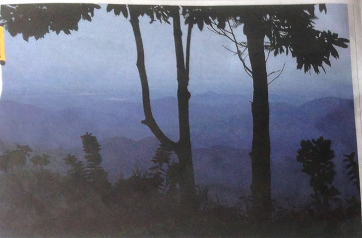
Utsikten en tidig morgon från hotellet 98 acres i Ella. För att komma hit tar man tåget mellan Kandy och Ella – en av de mest natursköna tågresorna i världen.